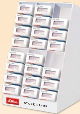
► Expositor Fórmulas Comerciales PI-024 de sellos auto-entintables