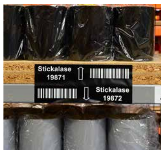
Etiqueta de inventario