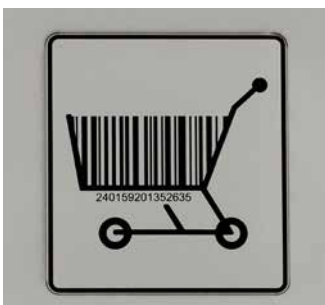
Pequeñas etiquetas para pegar