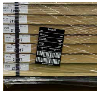
Códigos de barras