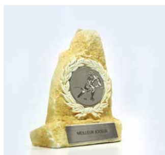
Placas de trofeo