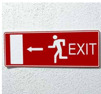
Etiquetas de seguridad